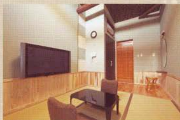
ゆったりとお寛ぎ頂ける客室