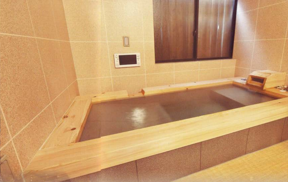
木の香りに癒される 寝湯タイプのひのき風呂