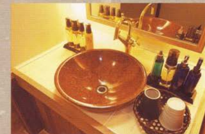
アメニティも充実