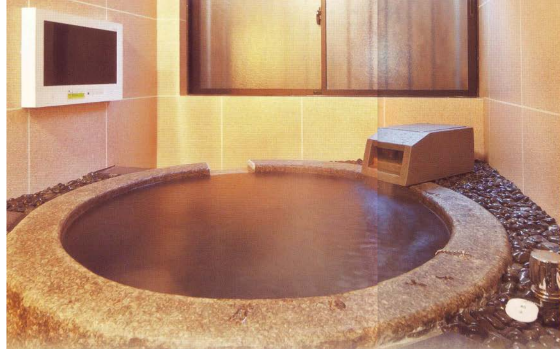
岩をくり貫いた 野趣あふれる 岩風呂