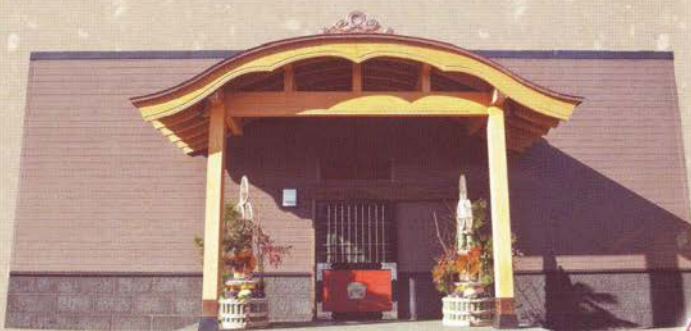
「旅籠」をイメージしたユニークで和テイストなエントランス

別府ならではの、本物の掛け流し温身なので、 体からすっきりと疲れを取ることが出来ます。 宿泊部屋では何度でもご入浴頂けますので、 十分に温泉をご堪能頂けます。