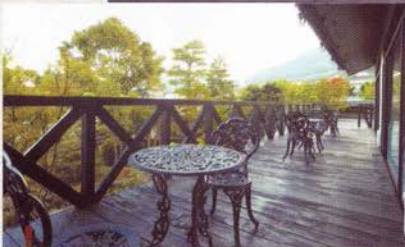
陽当たりの良いテラス