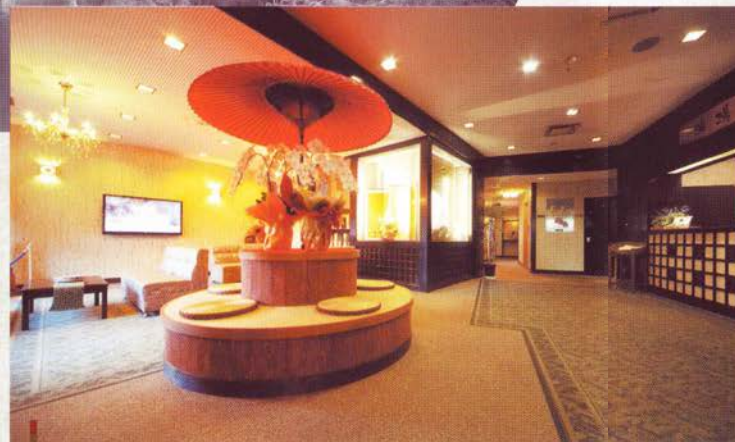
「和」モダンなイメージの空間が癒しを与えるフロント/ロビー