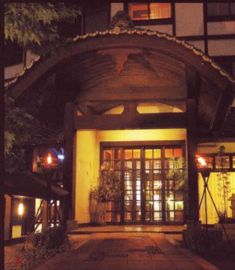
「和」を基調としたエントランス