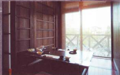
食事は個室でゆったと