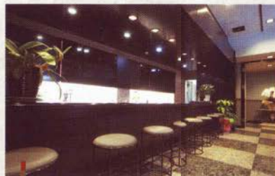
洒落た雰囲気のリウジ