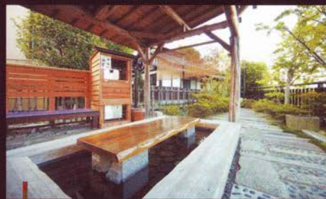
足湯には無料ビールサーバーを設置